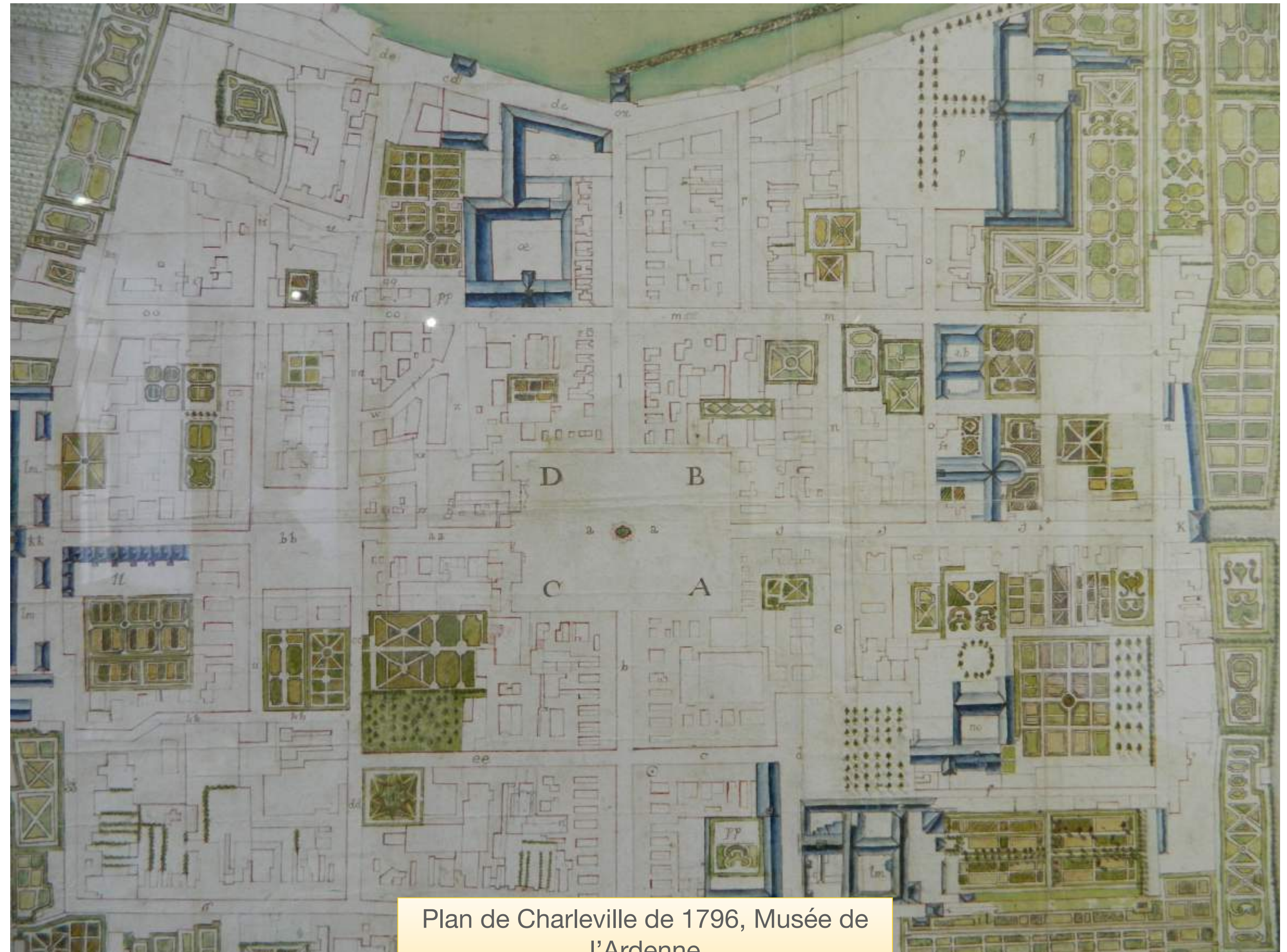
Plan de Charleville de 1796, Musée de l'Ardenne