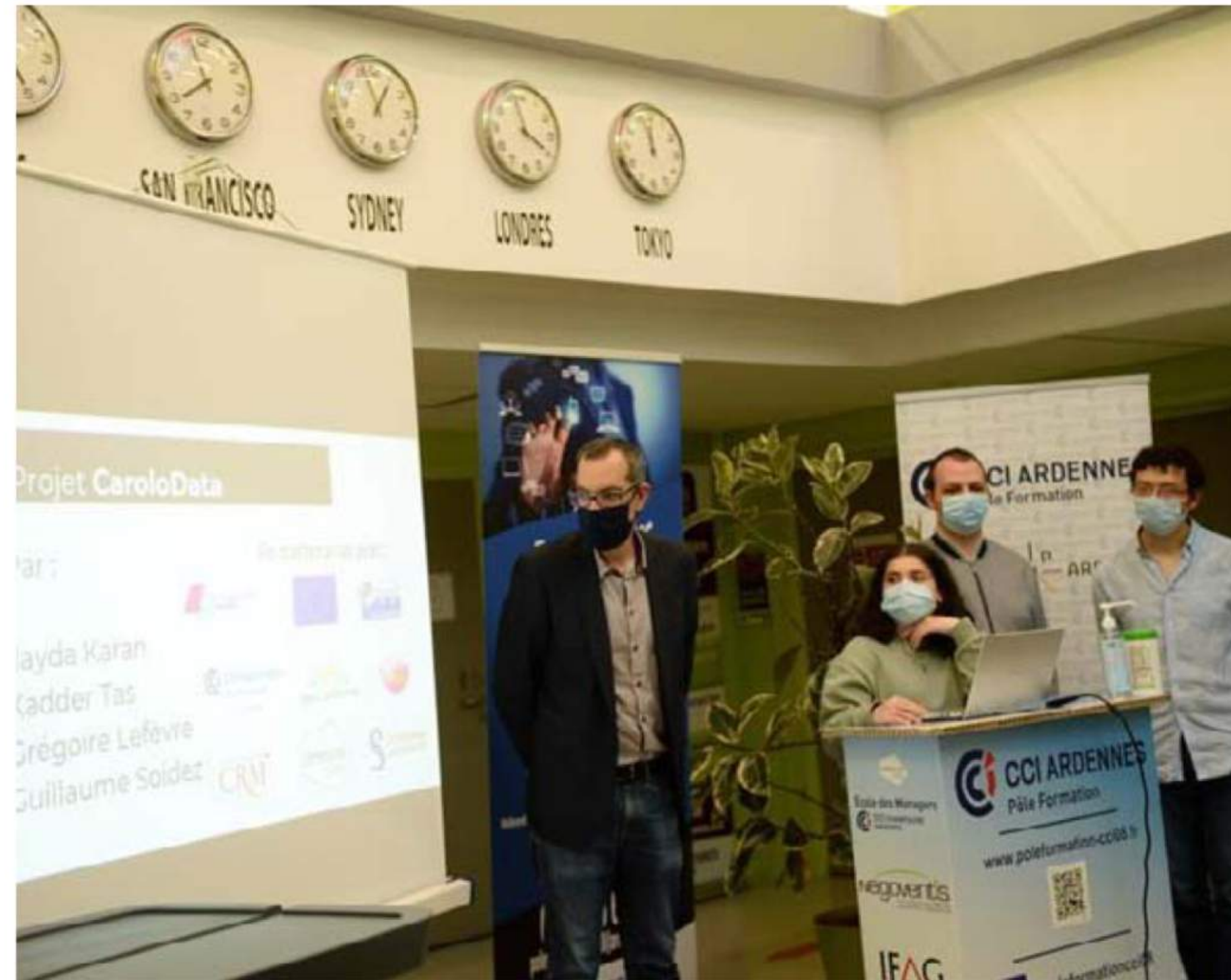
L'équipe gagnante de ce hackathon 2020. La victoire s'est jouée dans un mouchoir de poche : seuls deux points la séparaient de la deuxième !